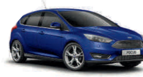
Deep Impact Blue «Металлик»* A S T

Стандартная комплектация A S W T Опция за дополнительную плату A S W T