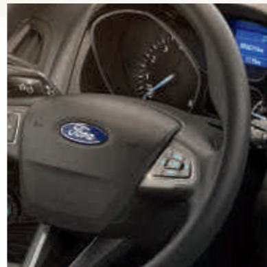
● Bluetooth и голосовое управление