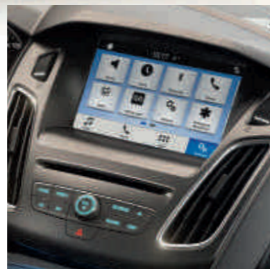
● Мультимедийная система SYNC 3