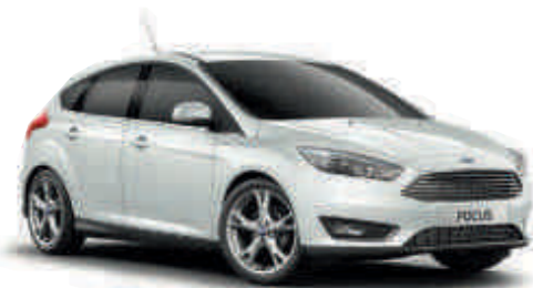
Frozen White* A S W T