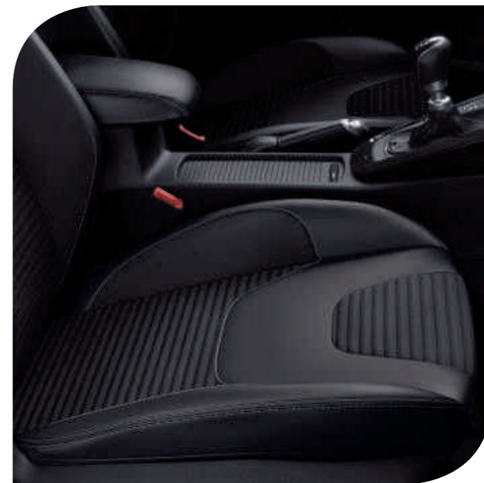
Тканевая обивка Groove/Lux Цвет Charcoal Black