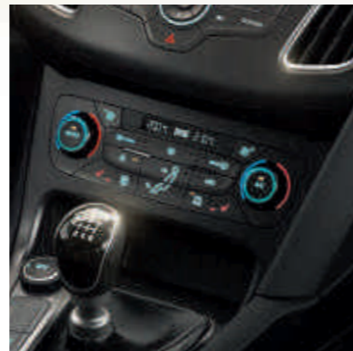
● Двухзонный климат-контроль