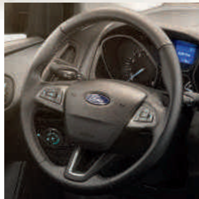
● Электрообогрев рулевого колеса