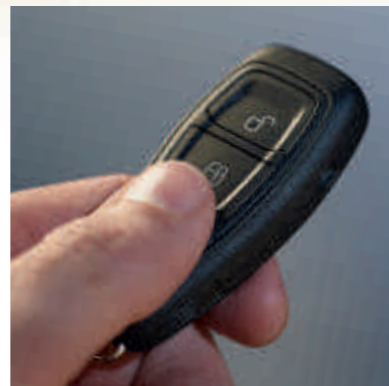
● Система MyKey®

*Примечание: Не допускается устанавливать детское кресло на сиденье переднего пассажира, если активирована фронтальная подушка безопасности. Максимальная безопасность ребенка обеспечивается при установке сиденья на одно из задних посадочных мест.