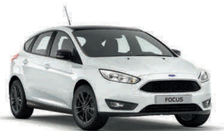
White & Black

Ford Focus может похвастаться не только элегантным дизайном, но и впечатляющим уровнем технологического оснащения, а также богатым выбором силовых агрегатов.