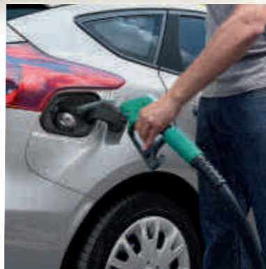
● Ford Easy Fuel