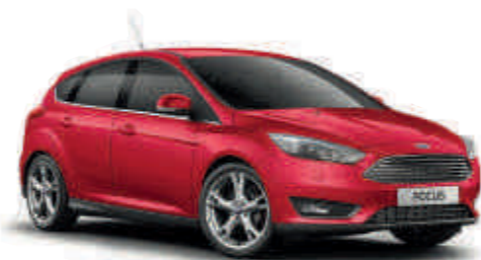
Candy Red S T Специальный «Металлик»*