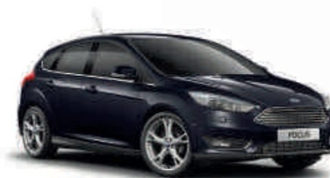
Shadow Black «Металлик»* A S T