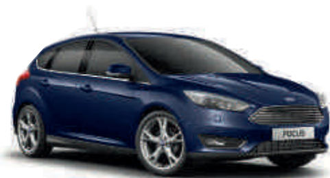
Blazer Blue A S T