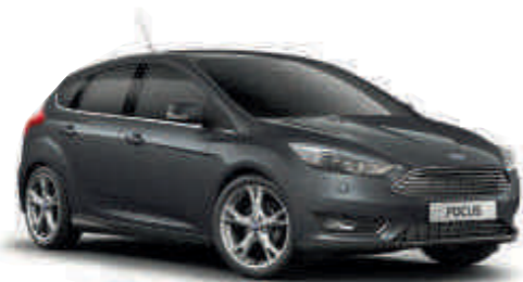
Magnetic «Металлик»* A S T