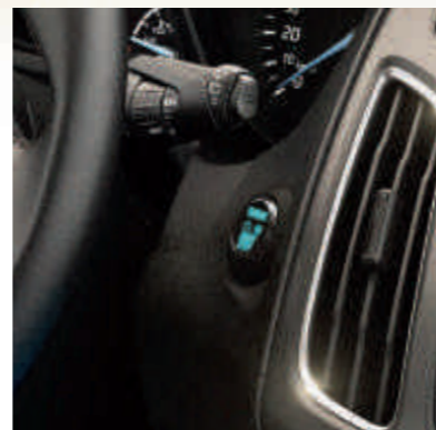
● Кнопка запуска двигателя