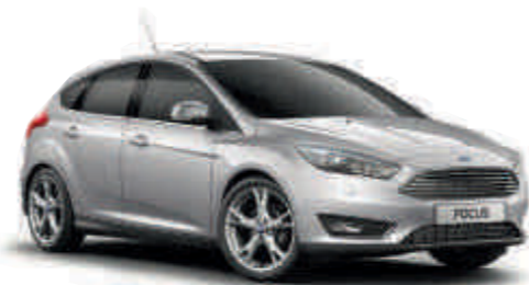
Moondust Silver «Металлик»* A S T