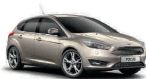
Tectonic Silver «Металлик»* A S T