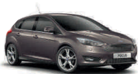
Lunar Sky «Металлик»* A S T